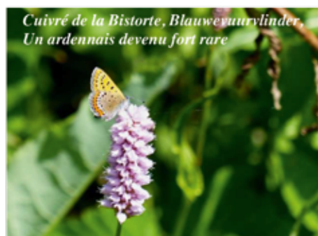
Cuivré de la Bistorte, Blauwevurvlinder, Un ardennais devenu fort rare

Pour accueillir les papillons dans son jardin, on peut faire plusieurs choses. Tondre sa pelouse, c'est bien. Mais pourquoi ne pas aménager dans un coin du jardin ou le long d'une bande herbeuse, un pré fleuri qui attirera les papillons, mais aussi abeilles et bourdons ? A cet effet, on peut se procurer en jardinerie, des semences de plantes à fleurs indigènes comme le coquelicot, le bleuet ou la grande marguerite qui attireront comme un aimant toute une faune d'insectes ailés. Ce coin de jardin sauvage ne doit pas être fauché plus d'une à deux fois l'an et de préférence après le 15 juillet. Vous pouvez également vous procurer des semences des plantes indigènes qui poussent naturellement dans la région.