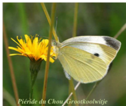
Piéride du Chou Grootkoolwitje

La Wallonie compte environ une centaine d'espèces de Papillons de jour. Certains sont très communs, d'autres plus rares, et quelques uns hélas en voie d'extinction sinon déjà éteints. On considère que plus d'un tiers de nos espèces wallonnes sont vulnérables ou en danger critique d'extinction. Or, les papillons constituent un excellent indicateur de la qualité de notre environnement. La raison en est qu'ils ont des exigences très pointues concernant leur habitat. La vie de leur chenille dépend de quelques plantes seulement, appelées plantes hôtes. Parfois même d'une seule plante comme pour le très rare Cuivré de la bistorte dont la vie dépend exclusivement de la Renouée bistorte. On peut encore trouver ce superbe petit papillon aux reflets bleus changeants dans quelques unes de nos vallées ardennaises.