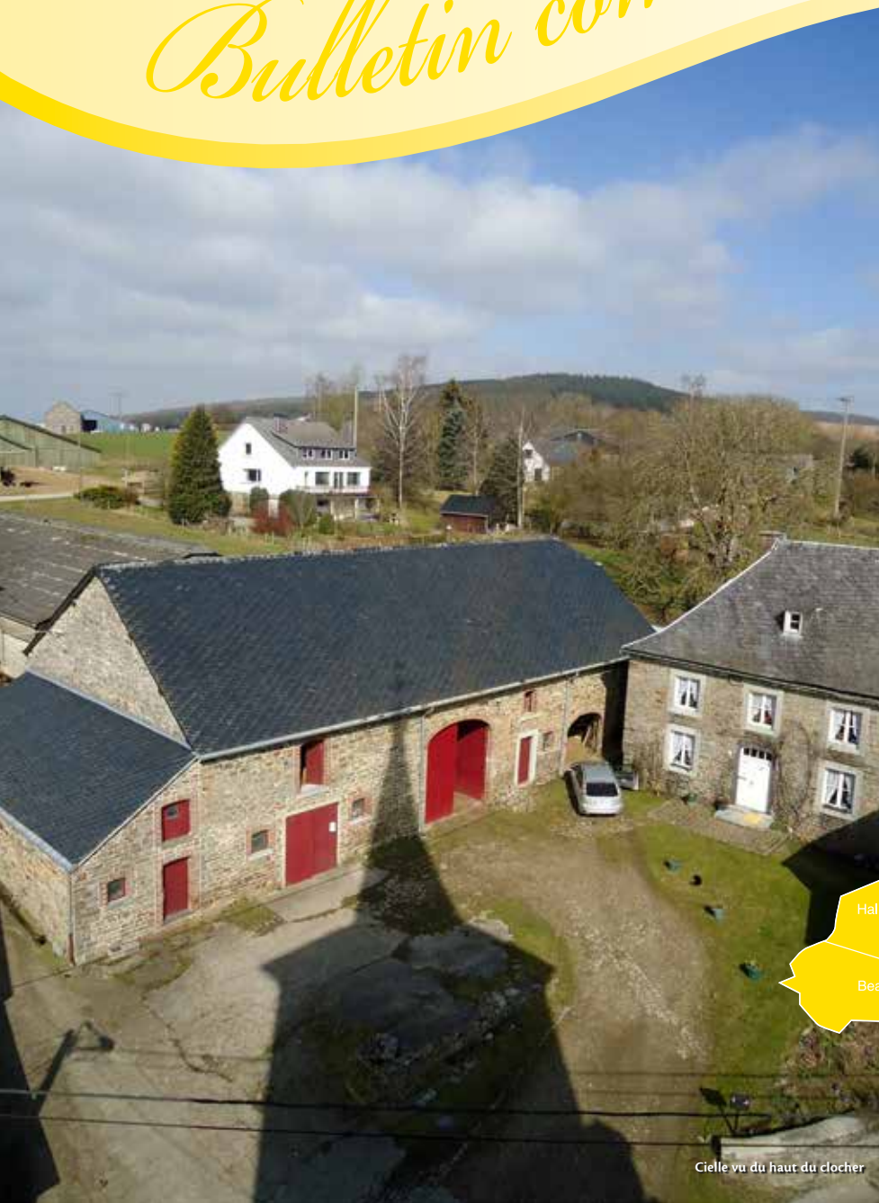
Cielle vu du haut du clocher