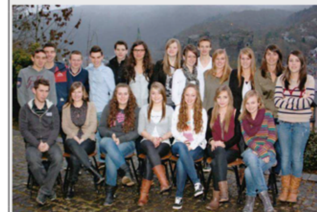
S'ils ne seront pas tous sur les planches, tous, par contre, à des degrés divers, ont participé à ce projet de classe.

La pièce « Fallait pas nous traiter de blancs-becs! » sera jouée les 16 et 17 mai prochains au Faubourg Saint-Antoine, Place du Bronze à La Roche-en-Ardenne. La capacité de la salle étant limitée, il est plus que prudent de réserver. Il est possible de se procurer des préventes au prix de 7 €. Elles sont disponibles au Syndicat d'Initiative, auprès des élèves de l'ISC ou encore via le 0476/36.27.73.